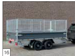
Option: Gitteraufsatz 700 mm hoch, mit Verschlüssen. Abnehmbar und pendelbar.