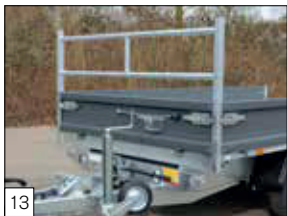
Serienausstattung: Verstärktes Gitter vorne, herausnehmbar, Vorderwand klappbar.