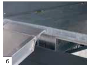
Serienausstattung: an der Heckseite ein U-Profil zum Anlegen der Auffahrschienen.