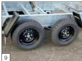
Serienausstattung: Bereifung 185/70 R13 C mit schwarzen Felgen.