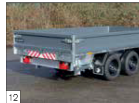
Serienausstattung: Stahlwände, 350 mm hoch (mit KTL-Behandlung und Pulverbeschichtung) und Abschirmung der Heckleuchte montiert.