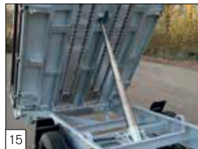
Serienausstattung: verstärktes Chassis mit solidem 5-Stufen-Hydraulikzylinder montiert.