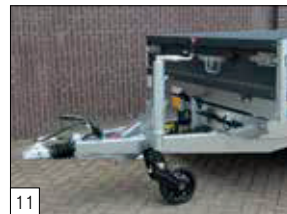
Serienausstattung: verstärktes Stützrad vorne.