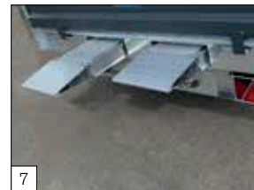
Serienausstattung: verstärkte Aluminium-Auffahrschienen, 2500 mm lang, integriert unter den Boden.