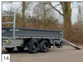
Serienausstattung: „Auffahr“-Paket: 2 verstärkte Auffahrschienen aus Aluminium, 2500 mm lang, mit 2 schweren Kurbelstützen.