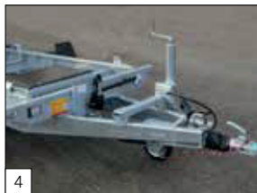
Serienausstattung: mit Nothandpumpe bei Elektropumpe ausgestattet.