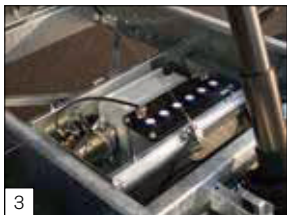
Serienausstattung: elektrische Bedienung inkl. Batterie in Stahlkasten mit Kunststoffdeckel.