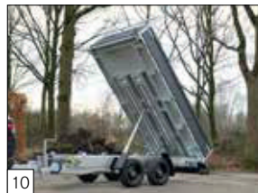
Serienausstattung: FERRO-Boden montiert; eine aus einem Stück Stahl gefertigte, 3 mm dicke und im Vollbad verzinkte Bodenplatte.