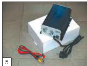
Serienausstattung: Batterieladegerät einzeln mitgeliefert.