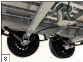
Serienausstattung: Parabelfederung inkl. Stoßdämpfern an den Achsen.